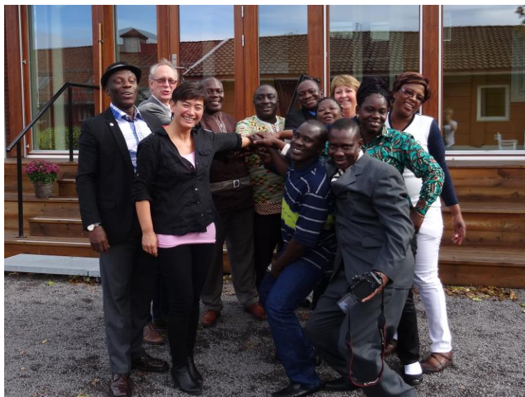
Mange av våre partnere samlet på kompetanseseminar i september

Kirkeprogrammet Partnership in Development (PID) er som en bro mellom våre 4 land. Den krysser over kontinenter og kulturelle forskjeller og bringer nærhet og kontakt med grasrota. Det er broer av vennskap og gode relasjoner. Vår forbindelse med Litauen er en annen bro. Vennskapsbroene formidler bedre liv og forvandling til Liberia, Zimbabwe, Sierra Leone, Litauen og Norge.